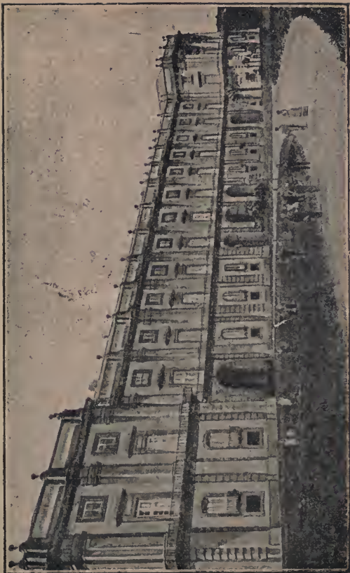
Palazzo Reale di Capodimonte.